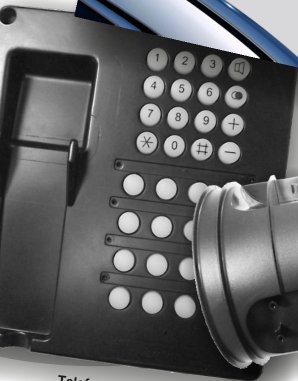
Telefonoberteil (Ex-geschützte Anlage)

Wir beraten Sie und testen mit Ihnen gemeinsam die Einsatzmöglichkeit.