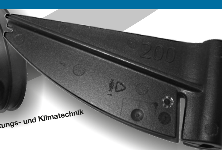
Lüftungs- und Klimatechnik